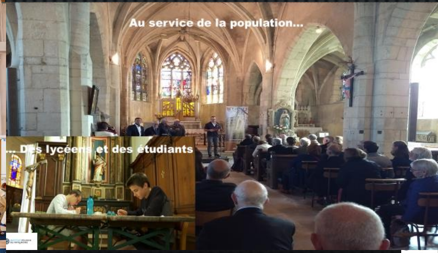
Au service de la population...