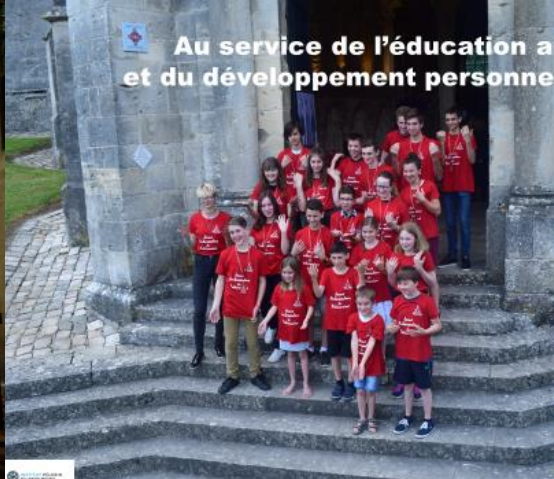
Au service de l'éducation artistique et du développement personnel des jeunes