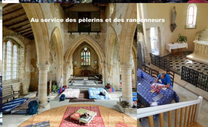
Au service des pèlerins et des randonneurs