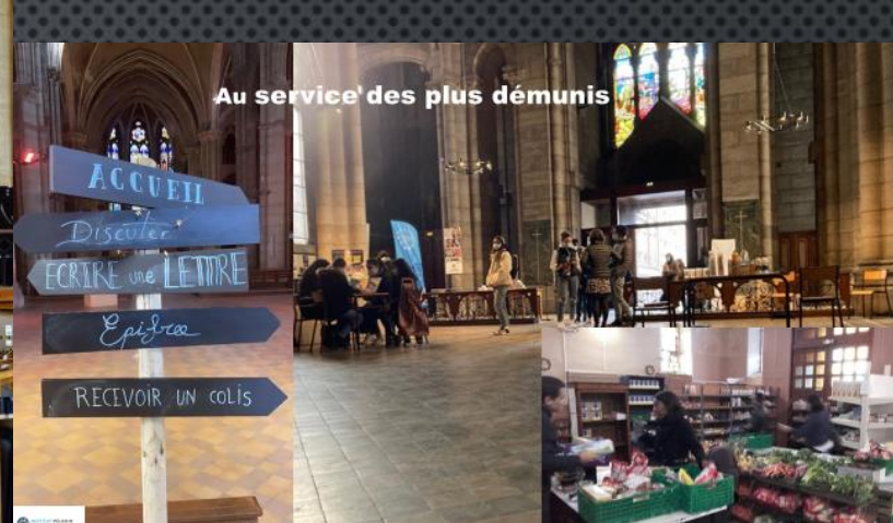
Au service des plus démunis