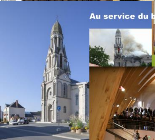
Au service du bien commun