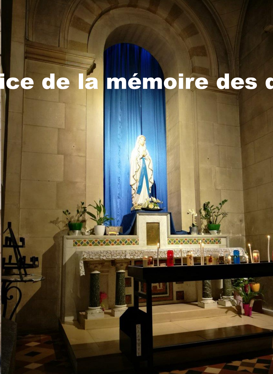
Saint Ruff à Avignon (Vaucluse)