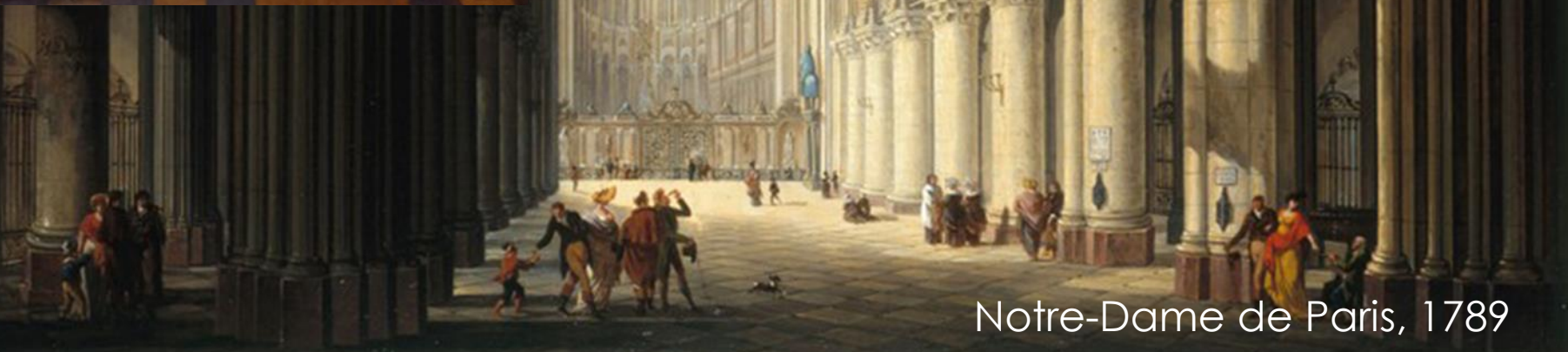
Notre-Dame de Paris, 1789