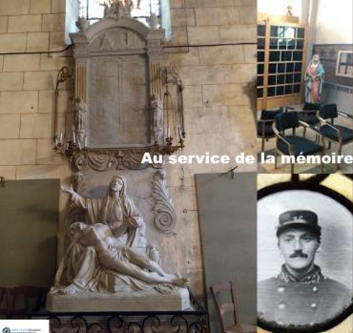
Au service de la mémoire des défunts