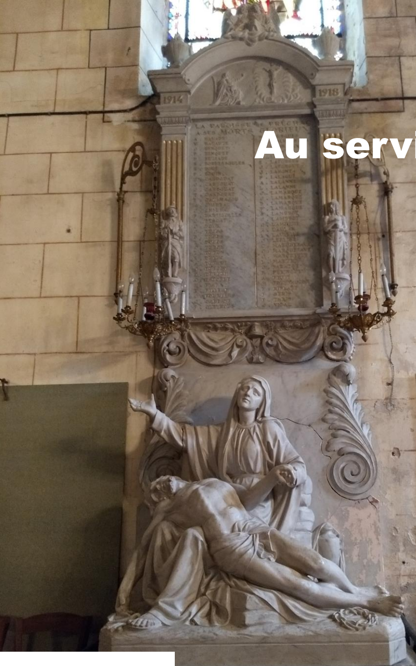
Saint Pierre de Préchac (Gironde)