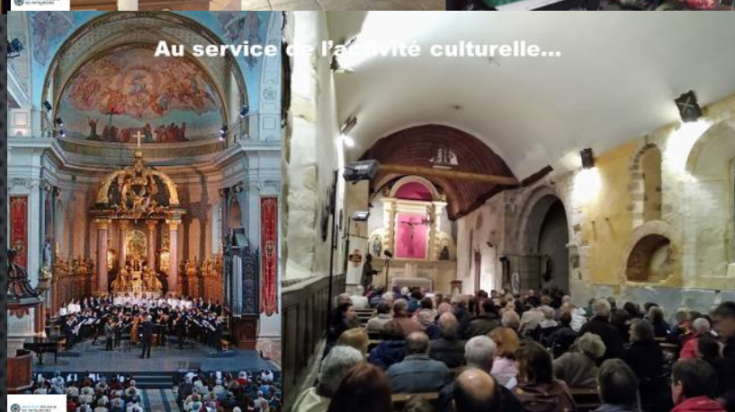
Au service de l'activité culturelle...