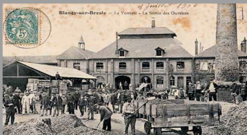
La verrerie Darras à Blangy-sur-Bresle au début du XX e siècle

La présence d'activités verrières dans la vallée de la Bresle, située à proximité de la forêt d'Eu, est attestée depuis le XVe siècle. À cette époque, les verreries étaient installées à proximité des massifs forestiers pour utiliser le bois comme combustible : le sable de silice - principal composant du verre - fondant à 1 600°C, il fallait environ 40 kilos de bois pour produire un kilo de verre.