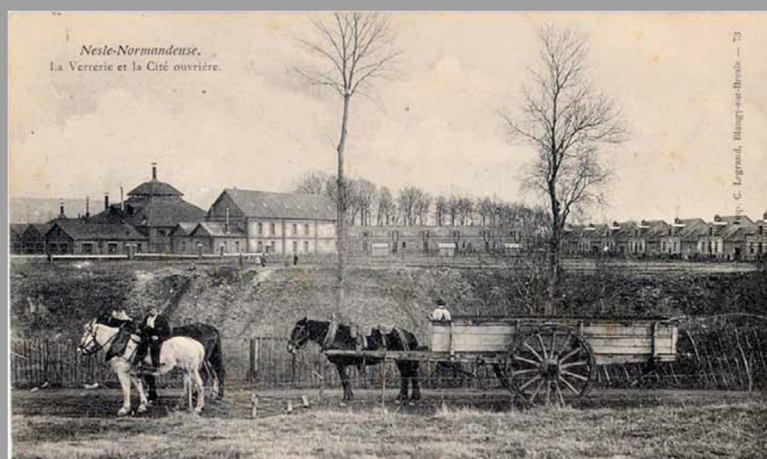
La verrerie et la cité ouvrière de Nesle-Normandeuse

À partir du milieu du XIXe siècle, les verriers importèrent d'Angleterre du charbon par Le Tréport pour alimenter les fours. Puis, à la fin du XIXe siècle, le transport du charbon justifia l'ouverture, en 1875, de la ligne de chemin de fer Paris-Le Tréport. Dès lors, le raccordement à la voie ferrée devint le facteur majeur du choix de la localisation d'une verrerie, pour l'approvisionnement en combustible et en matières premières mais aussi pour l'expédition des produits verriers. De nombreuses verreries furent alors créées pour s'orienter vers la production de flaconnage pour la parfumerie et la pharmacie. En 1882, c'est la famille Denin du Courval, qui implanta la première verrerie à Nesle-Normandeuse pour y produire des flacons.