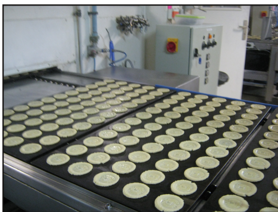
Les galettes prêtes à être cuites

En 2012, l'entreprise Traou Mad rejoint le groupe Galapalos, meilleure entreprise de biscuiterie bretonne.