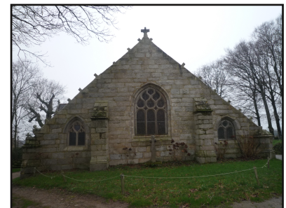
La chapelle de Trémalo