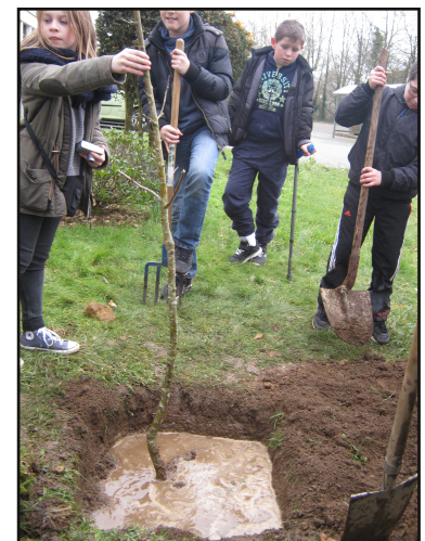
Les élèves plantent un porte-greffe