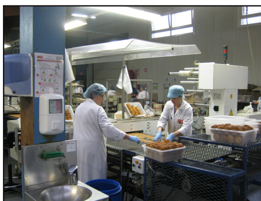
Les galettes sont emballées pour être livrées