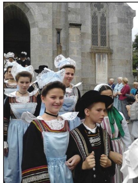
Le cercle celtique "Bro Goz Ar Milinou"