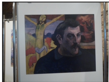
Paul Gauguin (1848-1903) Portrait de l'artiste au Christ jaune