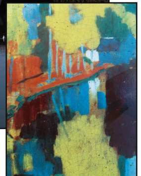
Le Talisman de Paul Sérusier, peinture synthétique du Bois d'amour

Au XIXème siècle, Pont-Aven n'était pas encore connue, c'était une petite ville. Autrefois, la rivière qui traverse Pont-Aven, l'Aven, était empruntée par les bateaux pour transporter du blé, du cidre et des pierres extraites du chaos granitique. Les moulins tournaient à plein régime d'où son surnom "ville des meuniers".