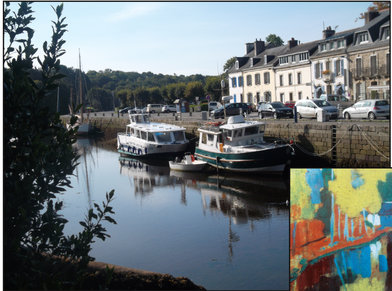
Le port de Pont-Aven