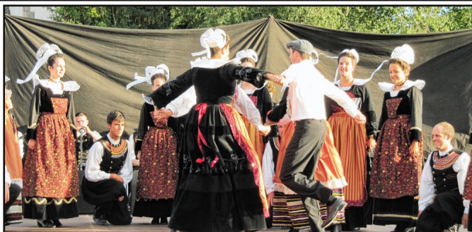
Le Cercle Celtique des Fleurs d'Ajonc ou "Bleuniou Lann an Aven" en breton

Cette fête a été créée en 1905 par Théodore Botrel à Pont-Aven, par l'un des plus anciens cercles bretons. Il y a une multitude de danseurs et de musiciens venant de toute la Bretagne qui se produisent sur scène. Les danseuses et danseurs portent des costumes du pays de Pont-Aven de différentes époques. Les cercles jouent des morceaux traditionnels, avec binious, bombardes ainsi qu'accordéons, guitares, basses, clarinettes, flûtes... Cette fête a lieu tous les étés le premier dimanche d'août.