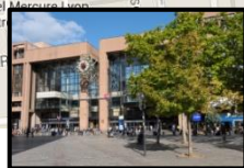
Gare SNCF Lyon Part-Dieu