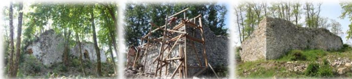
Château de Cazavet avant, pendant et après travaux

Retrouvez le patrimoine médiéval du Couserans sur couserans.forgottenworlds.org et munissez vous du livre-guide Châteaux et Forts Médiévaux en Couserans