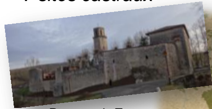
Rempart de Tourtouse

Etudes du bâti médiéval et travaux de restauration sur 7 sites castraux