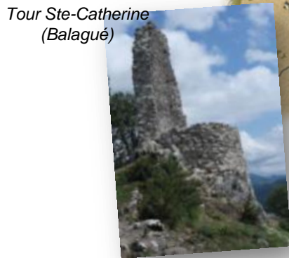
Tour Ste-Catherine (Balagué)