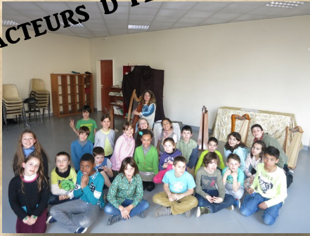
Les harpes de Dame Harpange nous entourent.