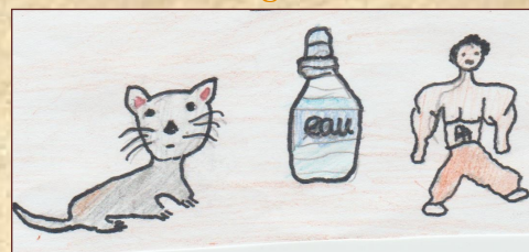
Un chat-eau-fort (un château fort)

Sauras-tu retrouver quelle est cette célèbre forteresse habitée par les nobles au Moyen-âge ?