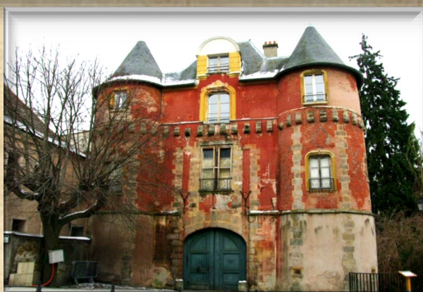
Le château Budé

D ous allons vous raconter le rallye historique que nous avons pu faire dans la ville de Yerres, notre ville.