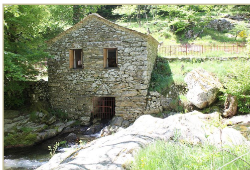
Moulin de la Fage