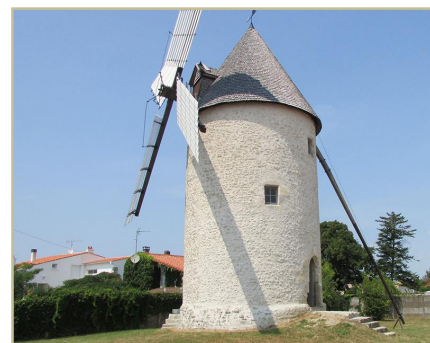
Moulin de La Plataine