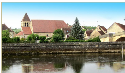
Eglise de Saint-Nizier