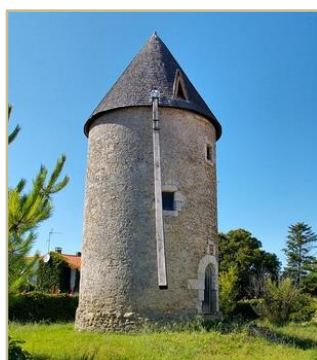
Moulin de La Plataine avant restauration

Il s'agit d'un moulin à vent du XVIIe siècle, construit en calcaire avec une toiture conique tournante couverte de bardeau de châtaignier et des ailes équipées du système Berton. L'extérieur de ce moulin, et son mécanisme intérieur ont été restaurés à l'initiative d'une association de bénévoles, « Les amis du moulin de la Plataine ». En partie détruits par la tempête de 1999, les boiseries et le mécanisme a été rénovés à l'identique. Le chemin de roulement en bois a été changé de manière à faire à nouveau tourner le toit en bardeaux de châtaignier. De nouvelles ailes ont été posées, pour remplacer celles détruites en 1999. Enfin le travail de restauration a permis la remise en