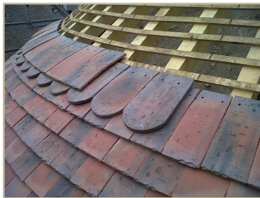
Pose des tuiles Aléonard sur l'église Saint-Nizier

L'édification de l'église d'Accolay a traversé les siècles, s'étalant du X e au XVIII e siècle. Cette longue histoire a fait de l'église un site archéologique particulier, abritant des sarcophages carolingiens, ainsi que du mobilier classé : trois statues de 1695 et une Vierge à l'enfant datant du XVIII e siècle. Engagée dans une démarche de préservation de cette église, étape des pèlerins de Vézelay, la commune d'Accolay a souhaité en 2013 rénover la toiture de son l'église, au niveau de la nef, du chœur et de l'abside. En partenariat avec la Délégation Bourgogne de la Fondation du