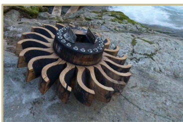
Roue à godet

C'est l'un des rares moulins du Parc naturel régional du Haut-Languedoc, de construction traditionnelle de type cévenol, dont la restauration a été entreprise en 2011 dans le cadre de la création d'une « route des moulins ». En plus de la restauration de la chaussée et du bassin d'eau, la machinerie de la chambre des meules et de la chambre d'eau ont été entièrement recréées selon le mécanisme d'origine. Ce projet de