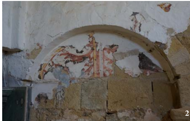
L'EGLISE ST-JEAN-DE- VIDAILHAC 1. Vue de la vieille église de Cocumont 2. Fresques médiévales ©Collection particuliere.