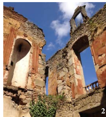
LE CHÂTEAU DEVILLEMONT 1. Le logis principal 2. Détail ©Collection particuliere.