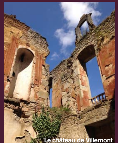
Le château de Villemont