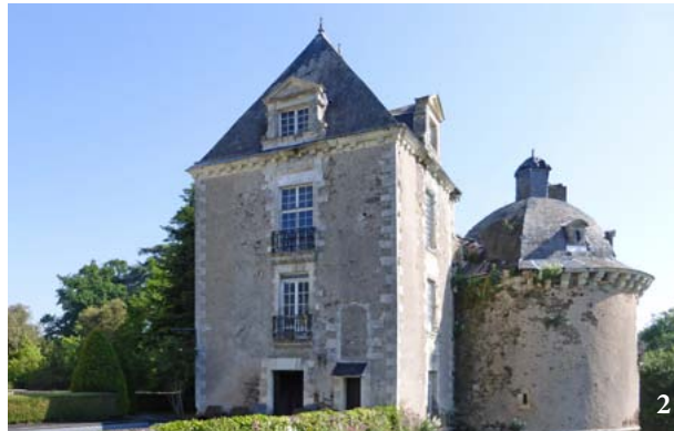
LE CHÂTEAU DE VAIR 1. L'ensemble du château 2. Tour et pavillon Est