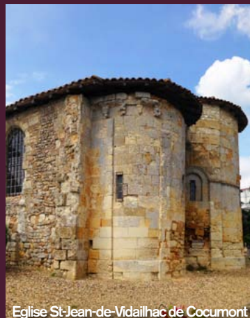
Eglise St-Jean-de-Vidailhac de Cocumont