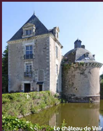
Le château de Vair