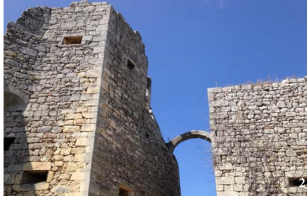
LA FOR- TERESSE D'OPPEDE 1. Vue d'ensemble d'Oppède-le- Vieux 2. Détail