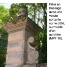
Pilier en cotoilage avec une acrotyle surmontée d'un acrotyle (MPF 16).