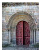
Portail d'entrée de l'église de Châteauneuf-sur-Charente. Il existe de nombreuses églises de ce style sur le territoire, ici, il s'agit d'un portail enlaid au décor de style roman (du XI e au XIII e siècle).