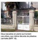
Deux balustrades en pierre surmontent ces piliers, sur même dénivelé de balustrade couronnée (MPF 16).