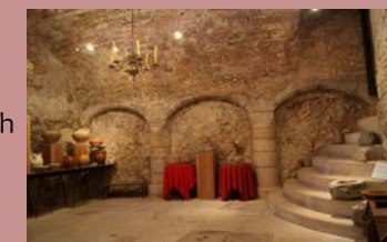
Maison musée@Asso Renaissance Patrimoine Bruniquel

Où : Maison musée Payrol Quand : samedi et dimanche 15 h - 19 h Contact : 05 63 67 25 23 GPS : 44°3'21.56"N - 1°39'57.20"E Gratuit