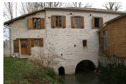
Moulin de St Géraud@MoulinsduQuercy

Où : Le Moulin de St Géraud Quand : samedi et dimanche 9 h - 18 h Contact : 05 63 67 68 99 GPS : 44°12'30.85"N - 1°18'52.41"E Gratuit