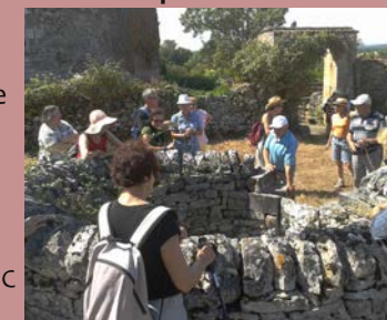
balade patrimoine@ APICQ

Où : patus de l'église du village, durée de la visite 3 h à 3 h 30 Quand : dimanche 15 h Contact : 06 10 69 49 75 GPS : 44°16'2.21"N - 1°39'55.15"E Gratuit