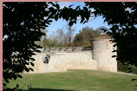
Château de Nègrepelisse