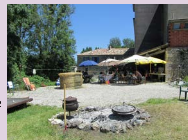
repas champêtre au Moulin de Ramond

Où : Moulin de Ramond Quand : samedi 18 h Contact : Réservation au 0615912708 ou 0563944768. GPS : 44°13'19.24"N - 0°59'35.96"E Participation non communiquée