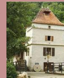
@ferme de la Vignasse

Où : Moulin de la Vignasse - vallée de la Bonnette Quand : dimanche 15 h - 19 h Contact : 05 63 24 08 31 GPS : 44°28.75'30.3"N - 1°79.68'01"E Gratuit