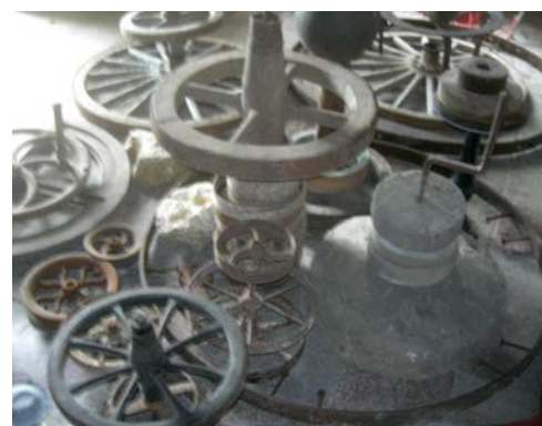
Accumulations rondes@Georges Duchayne

Où : Eglise de Castels site classé Quand : samedi 14 h - 18 h et dimanche 10 h - 18 h Contact : 06 63 49 78 00 GPS : 44°8'13.58"N - 0°53'0.03"E Gratuit