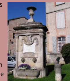
La fontaine du Thouron

Où : jardin de l'Office de Tourisme Quand : samedi 16 h Contact : 05 63 26 04 04 GPS : 44°9'39.69"N - 1°32'20.36"E Gratuit