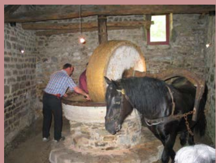
Moulin à huile de noix