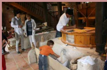
Moulin de Nègrepelisse