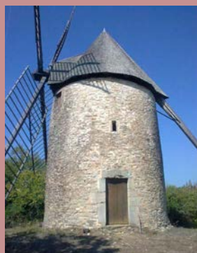
Moulin de saillagol@MoulinsduQuercy