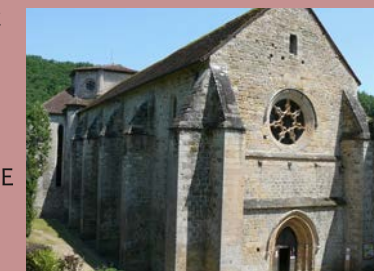
@Abbaye de Beaulieu

Où : Abbaye de Beaulieu Quand : samedi et dimanche 10 h - 12 h et 14 h - 18 h Contact : 05 63 24 50 10/13 GPS : 44°12'36.42"N - 1°51'10.75"E Prix : 5,50 euros