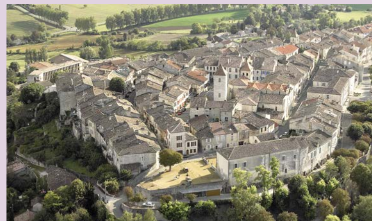
Vue aérienne de Lauzerte

Où : Office de Tourisme - Quand : samedi 15 h Contact : 05 63 94 61 94 - GPS : 44°15'24.94"N - 1°8'18.02"E Gratuit