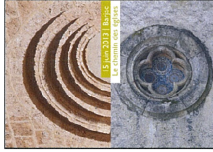
15 juin 2013 Barjac Le chemin des églises