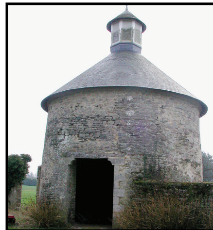
Visite guidée au château de la Grationnaye à

Malansac permettant la découverte d'un pigeonnier, d'une chapelle et l'extérieur du château. Cette visite sera réalisée en présence du propriétaire et sera commentée de manière historique et fonctionnelle.