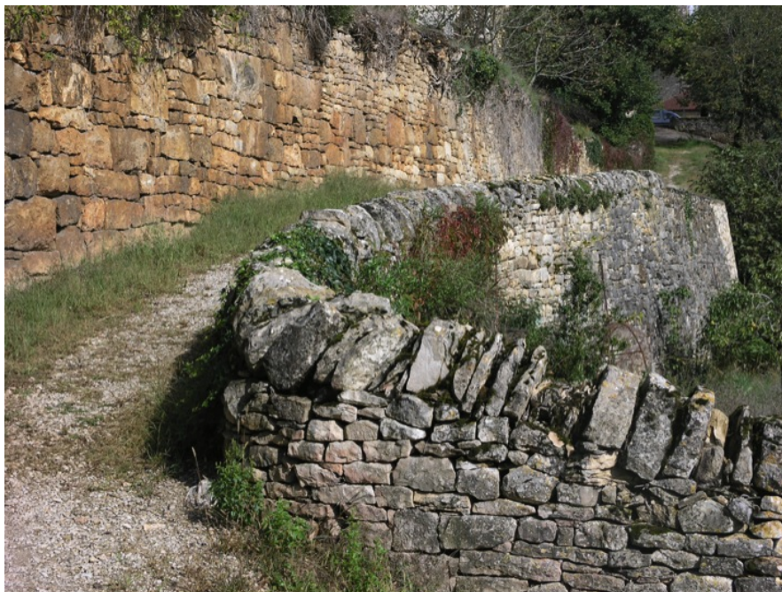
Chemin à Caylus, Tarn & Garonne, France.

Recaler une pierre de couronnement ou réparer une brèche dans un mur en pierre sèche, n'est-il pas plus simple que d'être contraint de démolir complètement un mur en béton affecté par l'âge, transporter ses gravats en décharge avec toutes les interrogations quant à leur devenir ? Hélicopter seulement des hommes sur un site d'altitude pour bâtir un mur anti éboulis ou restaurer un sentier de randonnée, n'est-il pas moins coûteux que d'hélicopter en plus, toute la journée, moult bétonnières?