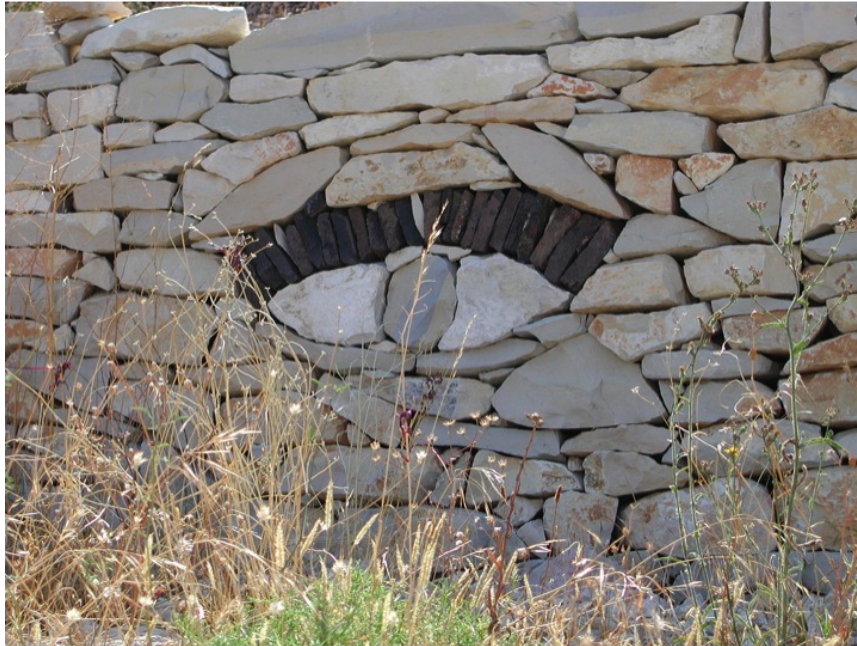
Soutènement du talus de la ligne TGV Méditerranée à Tavel, Gard, France, 1998.