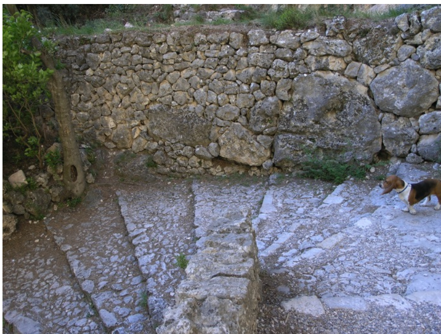
Chemin à Moustier Sainte Marie, Var, France.