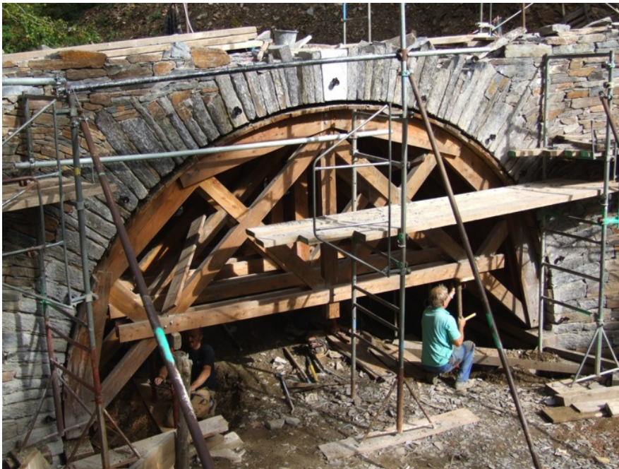
PEDRA: Reconstruction du pont de Chaldecoste, Lozère, France, ABPS et SETRA, 2011.