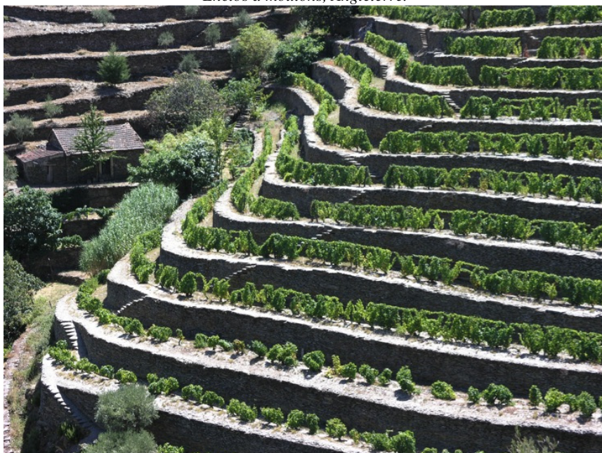
Vignoble en terrasses, Haut Douro, Portugal.