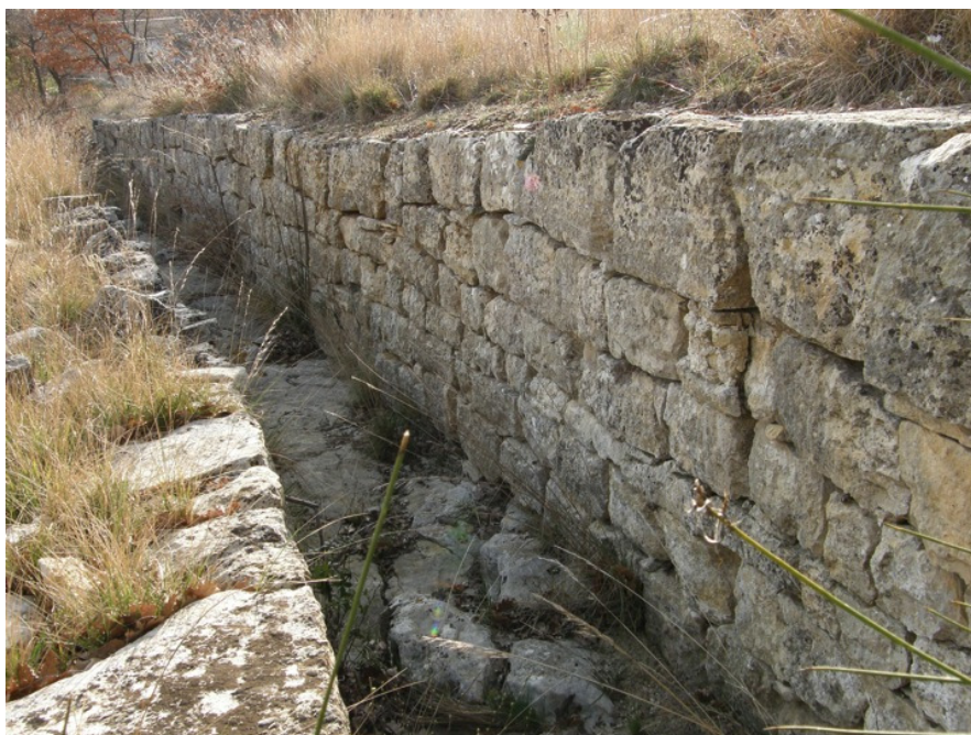
Pour la gestion de l'eau: un béal à Murs, Vaucluse, France.