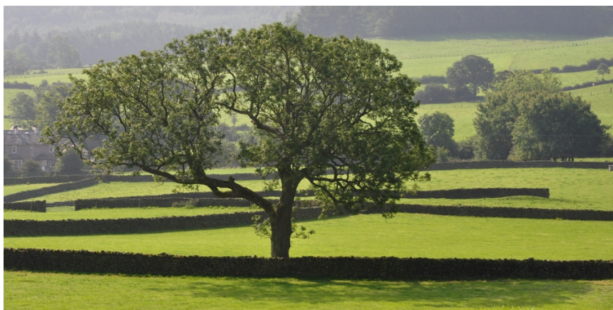
Enclos à moutons, Angleterre.