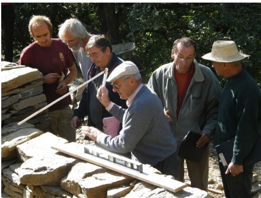
Mise au point de la grille d'évaluation du CQP entre les trois associations de professionnels