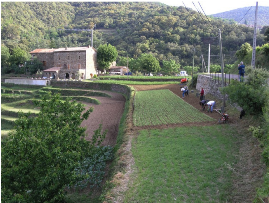
Oignons doux des Cévennes, France : Appellation d'origine contrôlée (AOC)

Pour les métiers du bâtiment et du jardin, cette technique accompagne le bâti, sublime la végétation, est porteuse de sens et valorise le savoir faire. Dans les territoires ayant une tradition lithique, pour les agriculteurs, les forestiers, les agents d'entretien de l'espace des collectivités locales et territoriales, renouer avec ces pratiques, c'est contribuer à une autre gestion du terroir : entretenir un paysage équilibré, en résonance avec le Grenelle de l'Environnement, dans un esprit de marketing territorial.