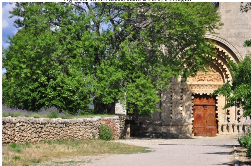
Accompagnement du Prieuré de Ganagobie, Alpes de Haute Provence, France.