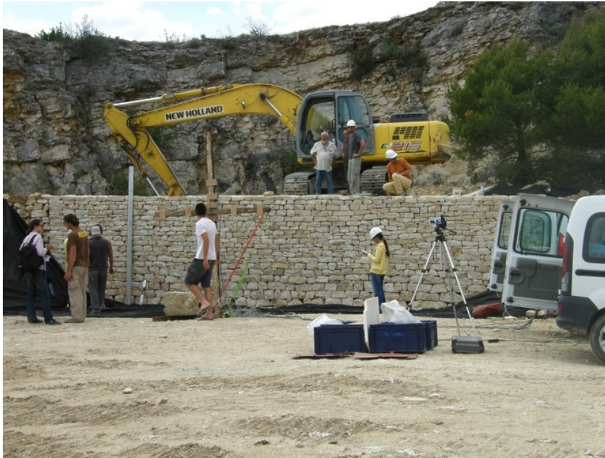
PEDRA: Soutènement expérimental à Saint Saturnin les Apt, Vaucluse, France, Muraillers de Provence et ENTPE, 2011.