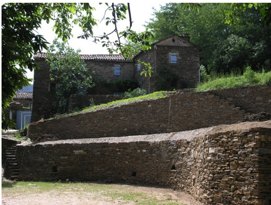
Création de terrasses pour accompagner un vieux mas dans le Gard, France, 2007.