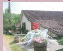
@Domaine de Maison Neuve

Visite du chai. Dégustation du vin de Cahors, foie gras, pâté de canards, tourtière. Où : Domaine de Maison Neuve Quand : samedi 9 h - 19 h Contact : 05 65 31 95 76 GPS : 44°25'48.98"N - 1°7'10.12"E - Gratuit