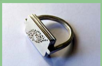
Bague Hoalu - Argent 925 @Anne Quintin artisan bijoutier

Animation: Visite du moulin à eau du XVI e siècle en cours de restauration et promenade le long du bief. Exposition-vente des bijoux en argent créés et réalisés par la propriétaire Anne QUINTIN. www.annequintin.com Où : Moulin de La Place au coeur du village de St Martin de Vers Quand : samedi et dimanche 14 h - 18 h Contact : 05 65 30 10 33 GPS : 44°34'51.18"N - 1°33'31.35"E Gratuit