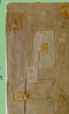
Sacs de blé temps ravaudé@Odile Teulière

"Sacs de blé dans la cave empilés au fil des ans l'étagère aux araignées. Tissés dans les toiles les pas les voix la sueur et le silence poids du grain la poussière et le pain dans la soupe." Aujourd'hui, de vieux sacs de blé, trouvés dans la cave de la ferme achetée, sont le support de son travail. Artiste : Odile Teulière Où : Ecomusée de Cuzals Quand : samedi 8 et dimanche 9 - du mercredi 12 au dimanche 16 de 14 h - 18 h Contact : 05 65 31 36 43 GPS : 44°31'3.69"N - 1°41'31.00"E Prix : Adultes : 5€ - Jeunes et groupes +10 pers : 2,5€ - Enfants jusqu'à 12 ans : gratuit