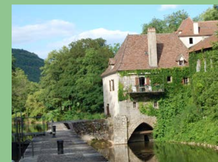
Moulin d'Aulanac @ Moulins du Quercy

Visite guidée du moulin, film documentaire Où : Moulin d'Aulanac Quand : samedi 10 h - 18 h Contact : 05 65 40 73 30 GPS : 44°28'0.43"N - 1°40'30.78"E Gratuit