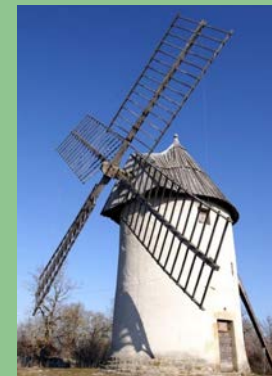
Moulin à vent du Mas de la Bosse Promilhanes@Moulins du Quercy

Visite du moulin et mise au vent ( si Eole le permet ) démonstration de mouture Où : Mas de la Bosse Quand : dimanche 15 h - 18 h Contact : 05 65 31 52 71 GPS : 44°22'29.63"N - 1°48'52.64"E Gratuit