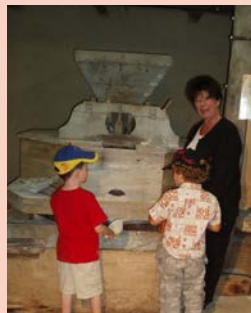
Moulin à eau des Conturies@Les Conturies

Visite guidée du moulin à eau sur le Veyr, démonstration de mouture. Commentaires sur le moulin à huile et sur la fabrication de l'huile de noix. Expo de vieux outils agricoles de nos grands-pères Où : Moulin des Conturies Quand : dimanche 9 h - 12 h et 14 h - 18 h Contact : 05 65 34 28 90 GPS : 44°41'4.80"N - 2°8'16.44"E Gratuit