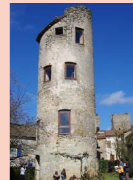
Tour ronde@OT Figeac bureau de Capdenac-Gare

ATTENTION 6 PERSONNES MAX PAR VISITE Partagez un moment privilégié avec Yves, l'heureux propriétaire des lieux, en découvrant l'unique tour ronde de Cardaillac, vestige d'une demeure seigneuriale qui aurait été celle du baron de Cardaillac-Lacapelle. Où : la « Tour ronde » Route de Fourmagnac Quand : dimanche 10 h 30 - 12 h 30 et 15 h - 17 h. Durée 15 mn environ Contact : 05 65 64 74 87 GPS : 44°40'49.11"N - 1°59'47.02"E Gratuit