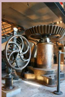
Engrenages de la Maison de l'eau

Maison de l'Eau, ancienne station de pompage de Cabazat. A deux pas du Pont Valentré, cette ancienne station de pompage, construite au 19 e siècle, servait à distribuer l'eau potable de la Fontaine des Chartreux aux habitants de Cahors. Réhabilitée en espace d'accueil et d'expositions, elle conserve ses mécanismes d'origine. Vous pourrez y découvrir l'histoire et bien d'autres informations liées au patrimoine de l'eau. Où : Maison de l'Eau, quai Albert Cappus Quand : samedi et dimanche de 14 h à 18 h 30 Contact : 05.65.53.04.99 GPS : 44°26'40.14"N - 1°25'51.77"E - Gratuit