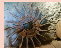
Rouet du moulin de Bouluech

Visite du moulin, animation poétique autour des meules, marché artisanal d'art Où : Moulin de Bouluech Quand : dimanche 9 h - 19 h Contact : 06 82 77 01 09 GPS : 44°39'13.92"N - 2°7'13.60"E Gratuit