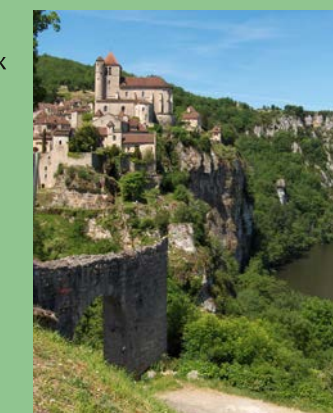
Village de St Cirq @ECassan-villageSCL

Une visite qui révélera de nombreux secrets et vous mènera dans des lieux habituellement fermés. Où : Devant l'Office du Tourisme Quand : samedi 11 h - 17 h Contact : 05 65 31 21 51 GPS : 44°28'0.43"N - 1°40'30.78"E Gratuit