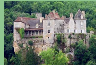
Château de Cénevières

Animation dans la première cour du château sur le patrimoine rond à voir dans le site et visite du monument Où : Château de Cénevières Quand : dimanche 10 h - 12 h 30 et 14 h - 18 h Contact : 05 65 31 27 33 GPS : 44°27'46.17"N - 1°45'9.87"E Animation gratuite - visite Ad. 4,50 € et Enf. 3 €