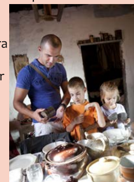
Activités au musée – Musée Eclaté@OT Figeac bureau de Capdenac-Gare

Les activités ludiques du Musée éclaté Programme en famille : suivez le guide et plongez vous dans la vie d'autrefois en pétrissant le pain, en visitant la maison du sémalier et le moulin à huile de noix. Tandis que les parents découvriront un savoir-faire ancestral en visitant la saboterie toute proche, les enfants joueront à des jeux d'autrefois. Un goûter sera ensuite offert aux enfants ! Participation pour le pâton : 1 € - Les enfants repartiront avec leur fabrication. Sur inscription à l'O.T. Où : Place de la Tour Quand : dimanche à 14 h. Durée 2 heures Contact : 05 65 64 74 87 GPS : 44°40'49.11"N - 1°59'47.02"E Gratuit