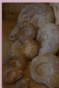
Ammonites@Musée A. Viré

Le musée Armand Viré se compose de trois espaces. Le premier présente des objets découverts lors des différentes fouilles archéologiques réalisées sur les alentours et l'Oppidum de l'Imparnal. Le second, des ammonites du Jurassique Supérieur de la région du Quercy, plus de 500 d'entre elles vous attendent pour vous faire remonter des millions d'années... Le troisième, l'Ichnospace, est consacré aux empreintes et aux traces fossiles de dinosaures datant du Jurassique Supérieur et traces d'animaux actuels. Vous y trouverez, entre autres, un moulage d'une piste de pas de 60 m 2 datant d'environ 140 millions d'années. Où : Office de Tourisme – Maison des Consuls, Rue de la Ville Quand : samedi 14 h - 17 h - dimanche 10 h - 12 h et 14 h - 17 h. - Contact : 05 65 20 17 27 GPS : 44°28'43.49"N - 1°17'10.73"E - GRATUIT