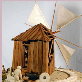
Moulin à vent portugais@La Planète des Moulins

Où : La Planète des Moulins – Quai Emile Gironde Quand : samedi 14 h - 17 h et dimanche 10 h - 13 h et 14 h - 17 h Contact : OT: 05 65 20 17 27 Jean Rogier: 06 80 83 24 24 GPS : 44°28'47.52"N - 1°17'8.42"E GRATUIT