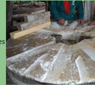
Ecomusée de Cuzals@Moulins du Quercy

Démonstration de « repiquage des meules ». Travail rare basé sur l'emploi d'une technique ancestrale. Les meules des moulins doivent être périodiquement « repiquées » (rhabillées ou battues). Cette action demande une technique dont le savoir et l'emploi sont devenus rares. Peu de meuniers savent encore la pratiquer. Où : Ecomusée de Cuzals Quand : dimanche 14 h - 18 h Contact : 05 65 31 36 43 GPS : 44°31'3.69"N - 1°41'31.00"E Prix : Adultes : 5€ - Jeunes et groupes + 10 pers : 2,5€ - Enfants jusqu'à 12 ans gratuit Musée ouvert du mercredi au dimanche de 14 h à 18 h