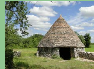
Cazelle de Novel@OT Lalbenque

14 h randonnée de +/- 10 km " Ronde des cazelles" à découvrir tout au long du parcours ; pigeonnier, puits, cazelles, châteaux. 16 h 30 visite de la cazelle de Novel avec explications sur sa rénovation. 17 h présentation du livret " Petit Patrimoine" de l'Office de Tourisme, suivi du verre de l'amitié. Où : Cazelle de Novel (D6 direction Cahors) départ et arrivée au même endroit Quand : samedi 14 h Contact : 05 65 31 50 08 GPS : 44°27'45.07"N - 1°44'48.86"E Gratuit