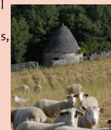
cazelle@ OT du Pays de Figeac

Blotti au pied d'une haute falaise, Marcilhac-sur-Célé profite des charmes bucoliques du causse et des paysages sculptés par la rivière. Les constructions en pierres sèches, véritables trésors vernaculaires, sont le reflet d'une activité pastorale, viticole, agricole très ancrée dans le Parc Naturel Régional des Causses du Quercy. Partez sur les pas de Didier, à la « recherche » de ces caselles, fontaines, pigeonniers ou gariotes dissimulées parfois dans les murettes. Découvrez ou redécouvrez leur histoire... Prévoir des chaussures de marche Où : Foirail - Quand : dimanche à 14 h - durée : 3 h environ de visite-promenade Contact : 05 65 64 74 87 GPS : 44°37'11.33"N - 2°4'58.55"E Gratuit