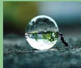
coincé la bulle@bibliothèque de Cénevières

A la bibliothèque EXPLO'RONDS l'univers du rond. Suite de l'exposition dans la cour du Château de Cénevières. Balade ludique « pour pas un rond » circuit libre dans le bourg. 12 h à 14 h vente de tartines rondes de foie gras, fritons, jambon, cabécous et pastis quercinois au camping du Grand Pré de Cénevières. Où : Bibliothèque Quand : dimanche 10 h - 12 h et 14 h - 18 h Contact : 05 65 31 21 79 GPS : 44°27'45.07"N - 1°44'48.86"E Gratuit