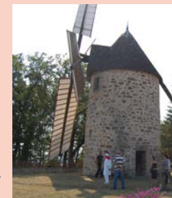
Moulin de Seyrignac- Lunan@MoulinsduQuercy

Visite guidée et commentée du moulin à vent et démonstration de mouture Où : Moulin de Seyrignac Quand : dimanche 14 h - 18 h Contact : 05 65 34 48 32 GPS : 44°37'11.33"N - 2°4'58.55"E Gratuit