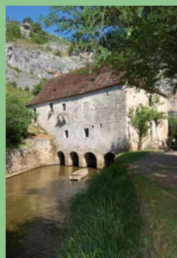
Moulin fortifié de Cougnaguet@Moulins du Quercy

Bâtiment classé en 1925, bâti par les moines cisterciens au 13 e s avec 4 paires de meules et rouet en cuve pouvant écraser 3 tonnes de grain/ jour pour nourrir les pèlerins qui passaient à Rocamadour dans leur périple vers Compostelle. Visite guidée et histoire commentée du moulin, de son mécanisme, de l'utilisation de la force de l'eau Où : Moulin fortifié de cougnaguet Quand : dimanche 10 h - 12 h et 14 h - 18 h Contact : 05 65 38 73 56 ou 05 65 32 63 09 GPS : 44°48'43.02"N - 1°33'38.43"E Prix : Adulte 2 €, enfants 1 €