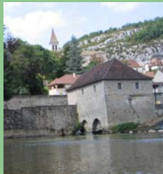
Moulin musée de Cabrerets@Moulins du Quercy

rouvre ses portes après de gros travaux sur la partie centrale hydroélectrique. Venez découvrir comment, grâce aux moulins, on fait de l'énergie renouvelable sans impact sur l'environnement et pas plus cher que le nucléaire. Notre petit musée familial sur les moulins a repris sa place et la boulangerie vous propose toujours de découvrir les secrets du gâteau " le Pastis" Où : Moulin de Cabrerets Quand : dimanche 10 h 30 - 12 h 30 et 14 h - 16 h 30. Contact : 05 65 31 28 52 GPS : 44°30'15.45"N - 1°39'16.77"E Gratuit