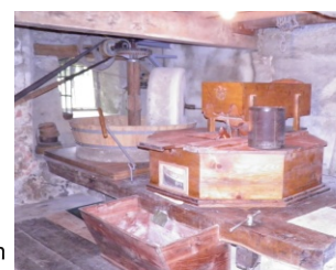
Moulin de Lancette

ANGLES 81250 : portes ouvertes au moulin de Lancette Petit moulin encore en état de fonctionnement, fabrication de farine, blutage. Autres applications de l'énergie hydraulique Où : Moulin de Lancette Quand : dimanche 10 h - 18 h Contact : 05 63 73 01 48 - 06 24 69 79 83 GPS : 43° 33' 16.91" N - 2° 32' 48.20" E Gratuit