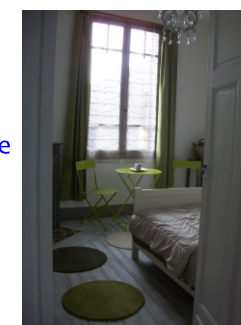
Maison d'hôtes@La Petite Charrette

MILHARS 811700 : hébergement - détente " La Petite Charrette" Pour votre séjour JPPM à Milhars, chambres d'hôtes 4 personnes Où : La Petite Charrette, Magali Mas Quand : tous les jours Contact : 06 75 15 50 32 GPS : 44° 40' 49.11" N - 1° 59' 47.02" E Site web : http://maisondhotemilhars.blogspot.fr/p/le-s-chambres-dhotes.html