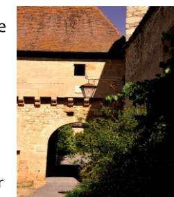
Vieux village - la Porte Haute

MILHARS 81170 : découverte du patrimoine bâti rond de Milhars Balade accompagnée et commentée à travers le village de Milhars permettant de découvrir la patrimoine bâti rond. Où : La Saulaie de Milhars - centre village à côté de la salle des fêtes Quand : samedi et dimanche 14 h 30 Contact : 05 63 56 36 68 GPS : 44° 37' 11.33" N - 2° 4' 58.55" E Gratuit