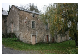
Moulin de Narulle

NAGES 81320 : Découverte du moulin de Narulle cité dans les archives dès le XV e s. Explication du fonctionnement et mise en route des meules pour démonstration Où : Moulin de Narulle RD 62 entre Nages et La Trivalle. Le moulin se situe au bord de la route à 1 km en venant de La Trivalle ou à 2 km en venant de Nages Quand : samedi 14 h 30 - 17 h Contact : 05 63 37 12 29 GPS : 43° 41' 45.90" N - 2° 46' 38.58" E Gratuit