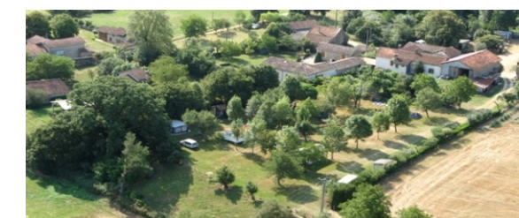
Ferme camping Les Landes@OT Pays de Vaour

MILHARS 811700 : hébergement - détente " Les Landes" Pour votre séjour JPPM à Milhars, camping arboré avec vue sur la rivière Aveyron et sa vallée Où : Ferme camping Les Landes Quand : tous les jours Contact : 05 63 56 37 54 / 06 20 23 05 30 GPS : 44° 40' 49.11" N - 1° 59' 47.02" E Site web : www.camping-milhars.com