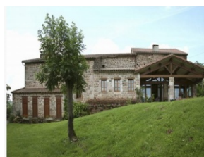
Ferme gîte Sérène@OT Pays de Vaour

Site web : www.bienvenue-a-la-ferme.com/midi-pyrenees/chambre-d-hotes/ferme-serene-2666-221854