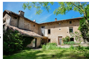
Le Muret

Site web : www.vaour-location-hebergement.com