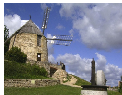
Moulin de Lautrec

LAUTREC 81440 : Le Moulin à vent Visite du moulin à vent du 17 e s et fabrication de farine, si le vent le permet Où : Moulin à vent Quand : samedi et dimanche 10 h - 12 h et 14 h - 17 h 30 Contact : 05 63 75 31 40 GPS : 43° 42' 16;97" N - 2° 8' 14.40" E Gratuit