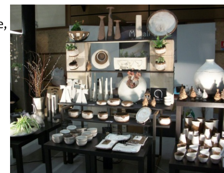
les créations de la potière@Magali MAS

MILHARS 81170 : Ca tourne rond chez la potière Travail du grès selon des techniques traditionnelles primitives, transmises par les femmes potières à travers le monde et les âges, trait d'union entre l'ancestral et le contemporain, mon travail raconte les couleurs de la poésie de la Vie, mon chemin de Terre. Démonstration de tournage, montage de grandes pièces selon des techniques primitives, visite de l'atelier, présentation de la production, expo, vente. Où : Atelier de céramique, le bourg Milhars Quand : samedi 10 h - 12 h et 14 h - 18 h - dimanche 15 h - 18 h Contact : 06 75 15 50 32 GPS : 44° 7' 38.47" N - 1° 52' 44.09" E Gratuit