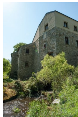
@moulin de Record-LE BEZ

LE BEZ 81260 : Le Moulin de Records Visite guidée du moulin, histoire de ce moulin seigneurial qui tourne de nouveau, contée par Jean-Pierre Mie, puis visite et démonstration de fabrication de farine. Animation buvette par Gabrielle et Christophe Mie, pour vous rafraîchir ou prendre un café sur la terrasse. Où : Moulin de Record - D66- parking au pont de Ferrières, à 150 m Quand : dimanche 10 h - 12 h et 14 h - 17 h Contact : 05 63 73 02 88 GPS : 44° 28' 0.43" N - 1° 40' 30.78" E Gratuit