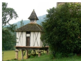
Gîte L'Hermitage@OT Pays de Vaour

Adresse de courriel : se.lacombe@wanadoo.fr Site web : http://www.gitelhermitage.fr