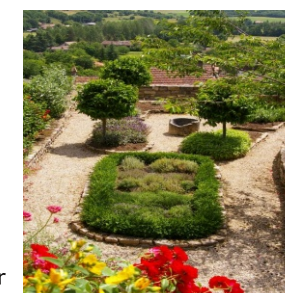
Milhars jardin@OT Pays de Vaour

MILHARS 81170 : Le prêt à poster Lancement de l'enveloppe " prêt à poster" illustrée avec le patrimoine rond de Milhars Où : salle des fêtes, centre du village Quand : samedi 10 h 30 Contact : 05 63 56 36 68 GPS : 44° 37' 11.33" N - 2° 4' 58.55" E Gratuit