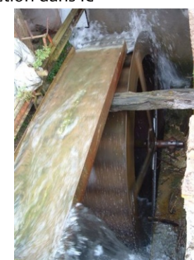
Moulin de Plantécaux

LOMBERS 81120 : Du blé au pain en passant par le moulin Visite du moulin. Fabrication de farine avec le blé de la ferme. Seule roue à aubes "par-dessus" en fonction dans le département Où : Moulin de Plantécaux Quand : dimanche 11 h - 18 h Contact : 05 63 55 53 26 GPS : 43° 49' 9.08" N - 2° 10' 2.84" E Gratuit