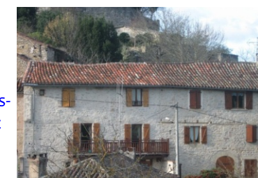
Les Ormeaux

MILHARS 81170 : hébergement détente "Les Ormeaux" Pour votre séjour JPPM à Milhars, chambres d'hôtes dans maison au coeur du vieux village Où : Les Ormeaux, Robert Laborie Quand : tous les jours Contact : 05 63 56 80 51 ou 06 11 32 19 91 GPS : 44° 7' 38.47" N - 1° 52' 44.09" E Site web: www.chambres-hotes-milhars.fr/introduction/index.html