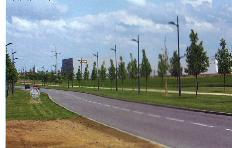
Le Bois de la Chocque et le parc des Autoroutes un ensemble urbain et paysager de qualité

En bordure du canal, la gare SNCF constitue une réelle entrée en plein cœur de la ville, dans un environnement exceptionnel conjuguant paysage urbain et paysage naturel avec le marais Chantraine, le parc et le marais d'Isle, unique réserve naturelle de France en milieu urbain . Sur l'autre rive, le quai Gayant, ancien quartier industriel, fait l'objet d'une reconquête entreprise dans le cadre du Programme