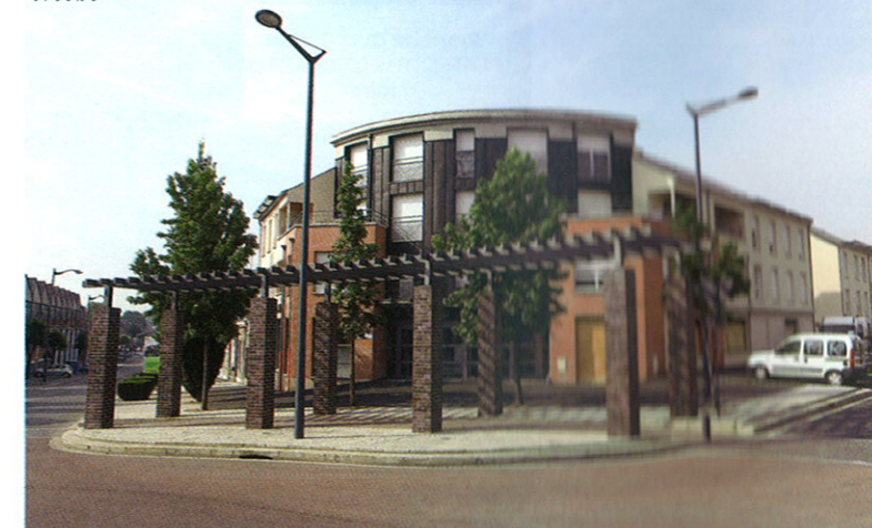
Faubourg d'Isle, Place Stalingrad. À l'emplacement de l'ancienne friche industrielle, un ensemble immobilier de 76 logements et une crèche

Aujourd'hui, les parcs d'activités des Autoroutes et du Bois de la Chocque s'inscrivent dans un ensemble urbain et paysager de qualité. Depuis 2007, l'attractivité de ces zones s'est encore accrue. De nouvelles entreprises ont été séduites par la qualité de leur environnement et leur facilité d'accès. Ainsi, par exemple, le parc des Autoroutes, dédié aux entreprises industrielles, artisanales et de services, a vu s'implanter 6 nouvelles entreprises ce qui représente aujourd'hui un total de 593 emplois sur le site.