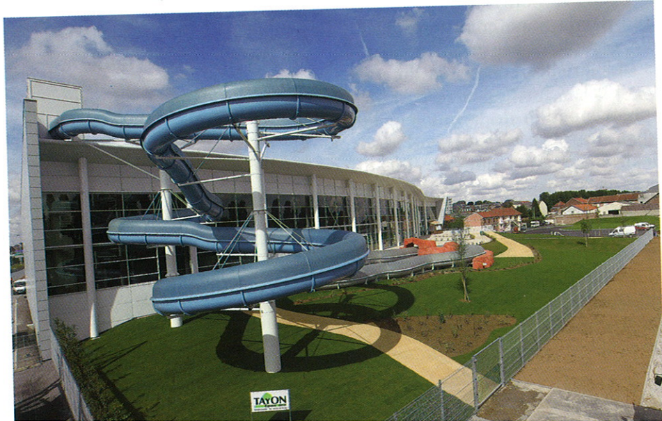
Base Urbaine de Loisirs