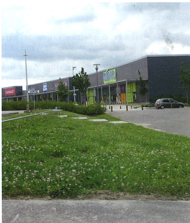
Photographies du Parc de la Baratière

Les démarches engagées par la collectivité afin de qualifier ses entrées de ville ont franchi, grâce au Parc de la Baratière, une étape tant en matière